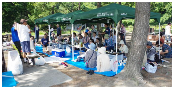
「みんなで楽しむ夏の終わりのBBQ」