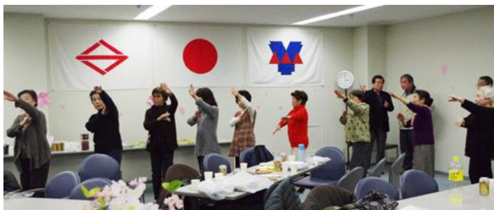
「みんなまとめてお疲れさん 花見会」